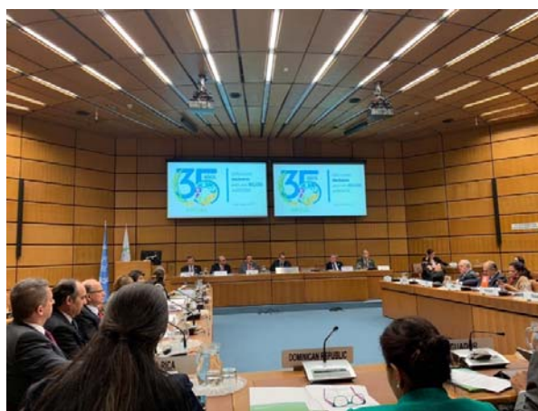
Figura 10. Participación en la XX Reunión Ordinaria del Órgano de representantes de ARCAL