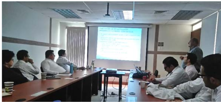
Figura 2. Reunión de trabajo sobre estructuras civiles en la CNLV

Con la donación del sistema de radiografía digital y del escáner láser, el OIEA al ININ estaría en condiciones de obtener el estatus de Centro Subregional de Referencia para la Inspección de Estructuras Civiles. En este sentido, a invitación de personal de la Central Nucleoeléctrica Laguna Verde, los días 16 y 17 de octubre del 2019, se tuvo una reunión de trabajo con expertos del OIEA sobre el tema del envejecimiento de estructuras civiles en la CNLV, realizada en las instalaciones de la Subgerencia de Ingeniería, ubicada en Dos Bocas, Veracruz.