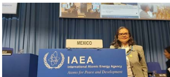
Figura 9. Participación de la Coordinadora Nacional en la 63ª Conferencia General