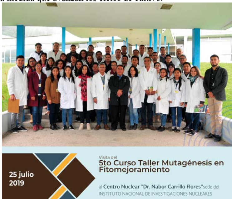
Figura 8. Participantes en el 5to. Curso Taller Mutagénesis en Fitomejoramiento. Primera Reunión de Coordinación del Proyecto RLA 5/078.

Fitomejoramiento, auspiciado por el Instituto Nacional de Investigaciones Nucleares, el Colegio de Postgraduados en Ciencias Agrícolas y el Colegio Superior Agropecuario del Estado de Guerrero, del 24 al 26 de Julio de 2019, con la asistencia de 42 participantes, procedentes de 11 instituciones de investigación y enseñanza agrícola. En este curso además del fundamento teórico, los participantes traen semillas, propágulos y cultivos in vitro de las especies de interés en su región, para iniciar el proceso de fitomejoramiento. El ININ continúa asesorando en la medida que avanzan los ciclos de cultivo.