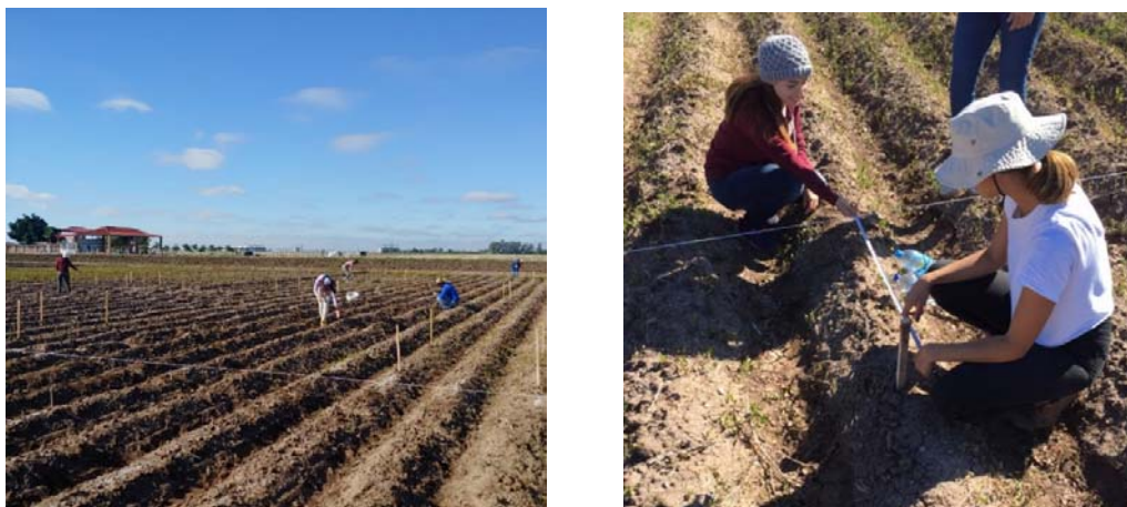
Figura 13. Marcado de las parcelas y microplots para ^{15}\text{N}

Se analizó el impacto de la inoculación del consorcio de Bacillus en el rendimiento a través de la medición de sus componentes (tamaño de la espiga, espigas por metro cuadrado, número de granos por espiga y toneladas de grano por hectárea) contrastando así las características de la producción obtenidas en la cosecha.