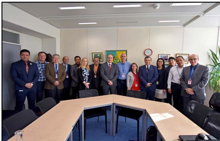
Figura 2. Participación en la Reunión final de coordinación del proyecto

También participó en la reunión final de coordinación del proyecto “ Creating Expertise in the Use of Radiation Technology for Improving Industrial Performance, Developing New Materials and Products, and Reducing the Environmental Impact of the Industry ”, del 2 al 4 de Diciembre del 2019 en el Organismo Internacional de Energía Atómica, en Viena Austria.