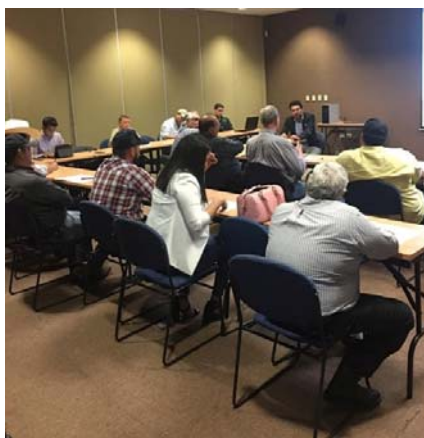
Figura 7. Participación en el 2do. Foro “Alternativas agro-biotecnológicas de vanguardia para contribuir a la seguridad alimentaria de forma sostenible en Sonora, México

-Organizador de los Foros Regionales “Alternativas agro-biotecnológicas de vanguardia para contribuir a la seguridad alimentaria de forma sostenible”, en los que se invitaron a productores e instituciones de gran importancia para la región, tales como: Junta local de Sanidad Vegetal, Distrito de Riego, Asociación de Productores de Hortalizas del Yaqui y Mayo, Agrícola AGROBO, entre otras celebrados en distintas fechas.