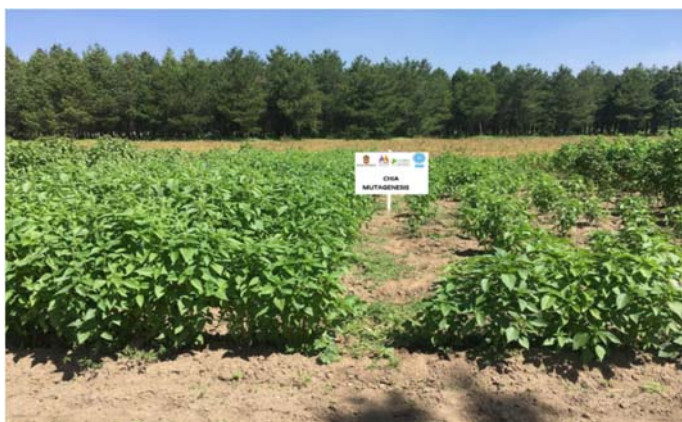
Figura 14. Experimentos de mutagénesis radioinducida, a partir de los cuales se han seleccionado dos líneas óptimas para incorporarlas a estudios de uso de eficiencia del uso de Nitrógeno mediante técnicas isotópicas.

Se establecieron experimentos, que involucran fitomejoramiento por mutagénesis, para identificar a los genotipos óptimos para incorporarlos estudios de uso eficiente de nitrógeno mediante técnicas isotópicas.