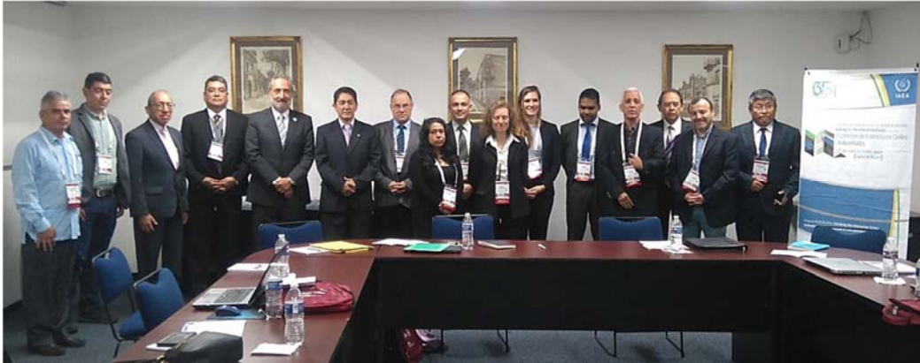
Figura 3. Segunda reunión de coordinación del Proyecto ARCAL RLA/1/014, Cd de México

esta reunión se presentaron los avances tenidos en cada país participante, se revisó y actualizó la matriz del marco lógico y el plan de trabajo del proyecto.