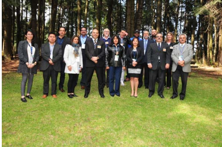
Figura 5. Taller sobre Seguridad y herramientas generales de gestión de instalaciones en el Centro Nuclear de México

ACUERDO REGIONAL DE COOPERACIÓN PARA LA PROMOCIÓN DE LA CIENCIA Y LA TECNOLOGÍA NUCLEARES EN AMÉRICA LATINA Y EL CARIBE