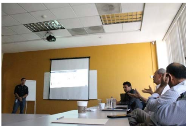
Figura 11. Participación de un colaborador en el 1er. Foro “Alternativas agro-biotecnológicas de vanguardia para contribuir a la seguridad alimentaria de forma sostenible”.

Se organizaron Foros Regionales “Alternativas agro-biotecnológicas de vanguardia para contribuir a la seguridad alimentaria de forma sostenible”, a los que se invitaron a productores e instituciones de gran importancia para la región, tales como: Junta local de Sanidad Vegetal, Distrito de Riego, Asociación de Productores de Hortalizas del Yaqui y Mayo, Agrícola AGROBO, entre otras.