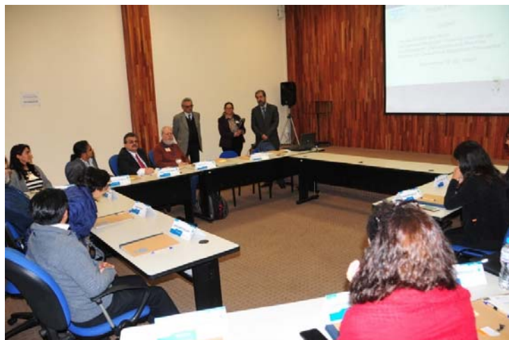
Figura 6. Curso Regional de Capacitación Avanzada realizado en el Centro Nuclear de México